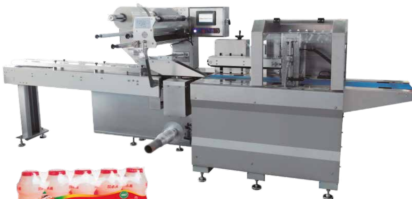
EUTO SHIRINK FP 100WL