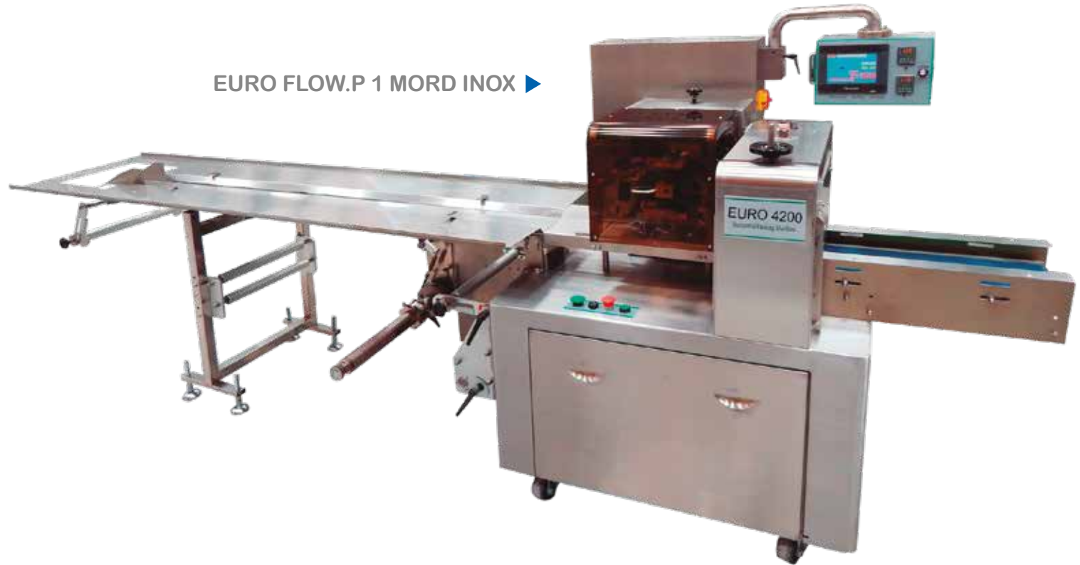
EURO FLOW.P 1 MORD INOX ▶