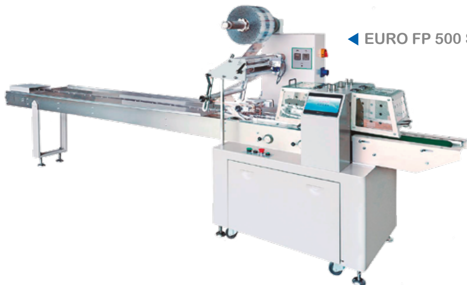
◀ EURO FP 500 SERVO