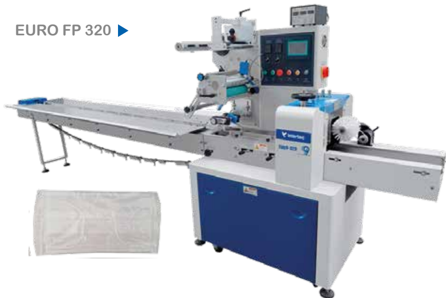
EURO FP 320 ▶