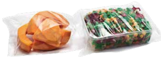
EURO FP 600 PBA ▶