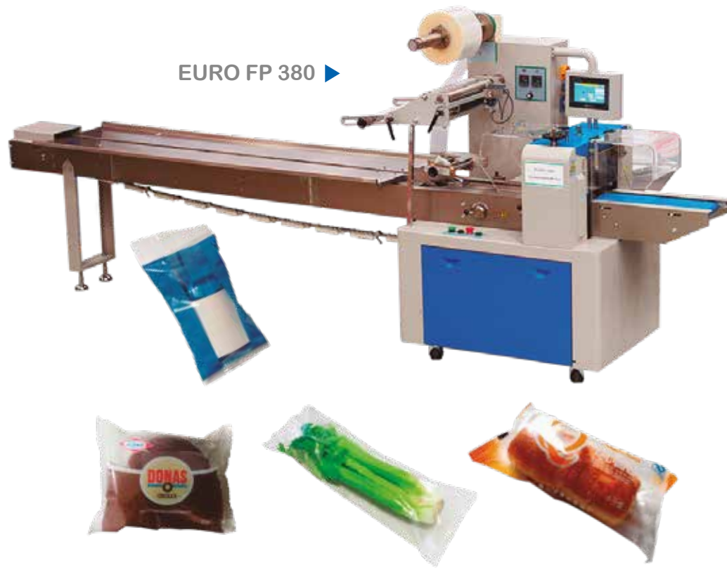
EURO FP 380 ▶