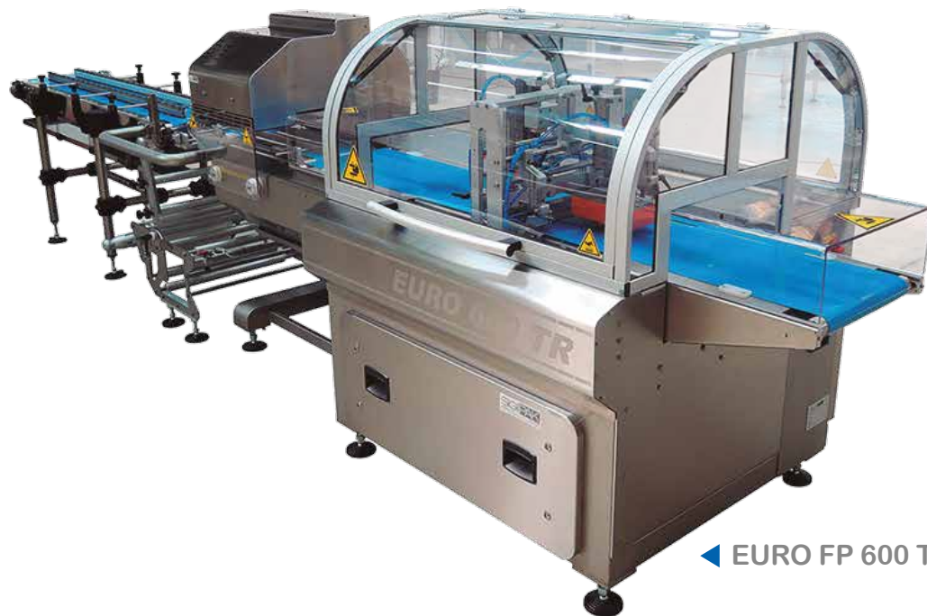
◀ EURO FP 600 TR