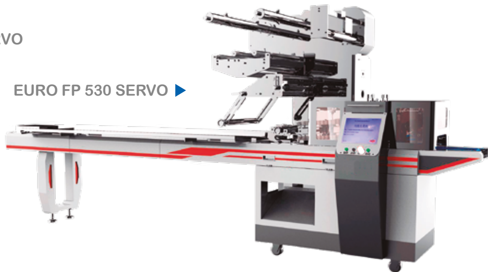
EURO FP 530 SERVO ▶