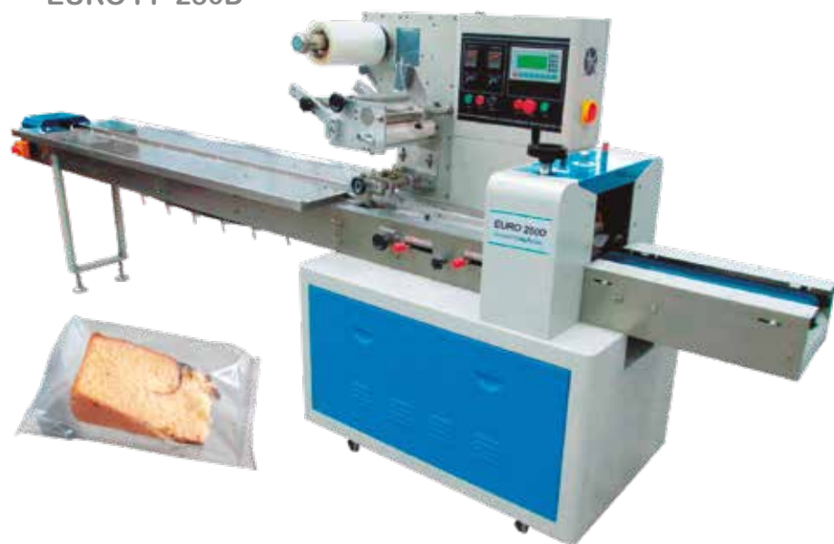
EURO FP 250B ▶ EURO FP 250D