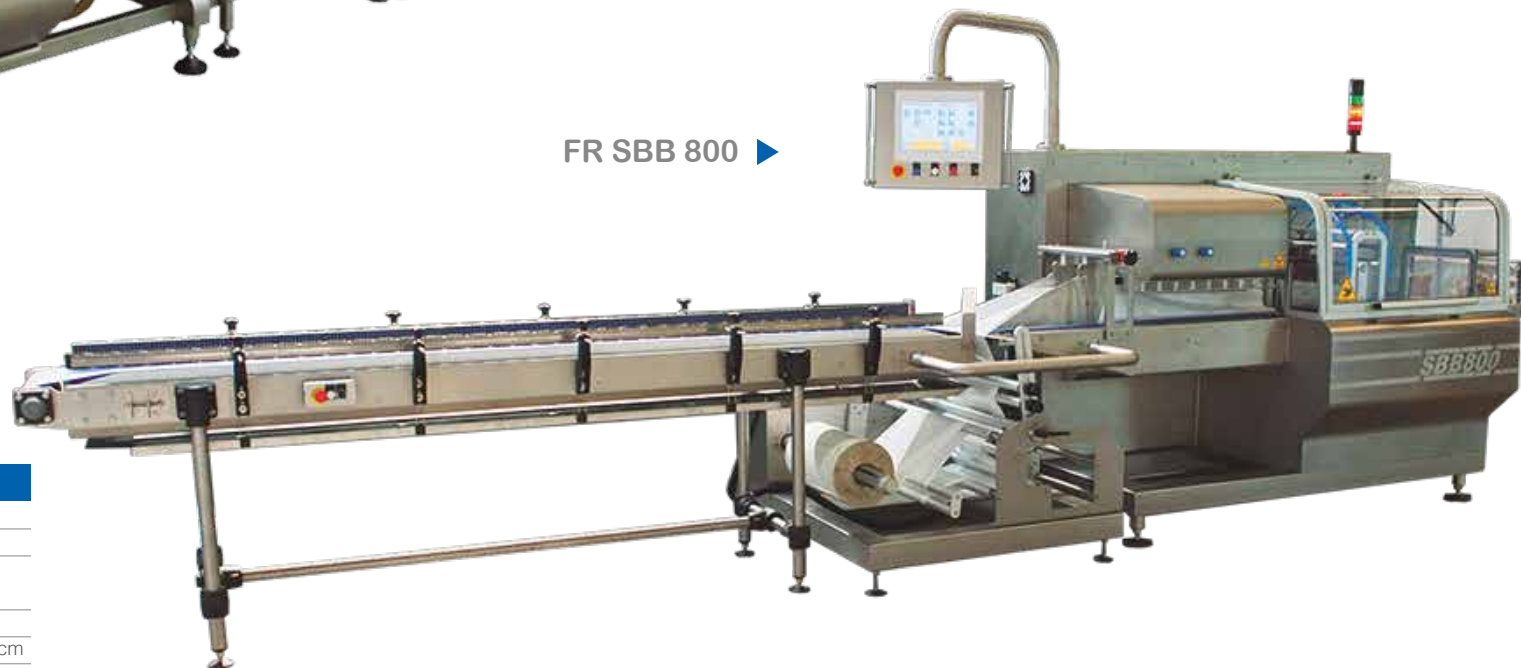
FR SBB 800 ▶