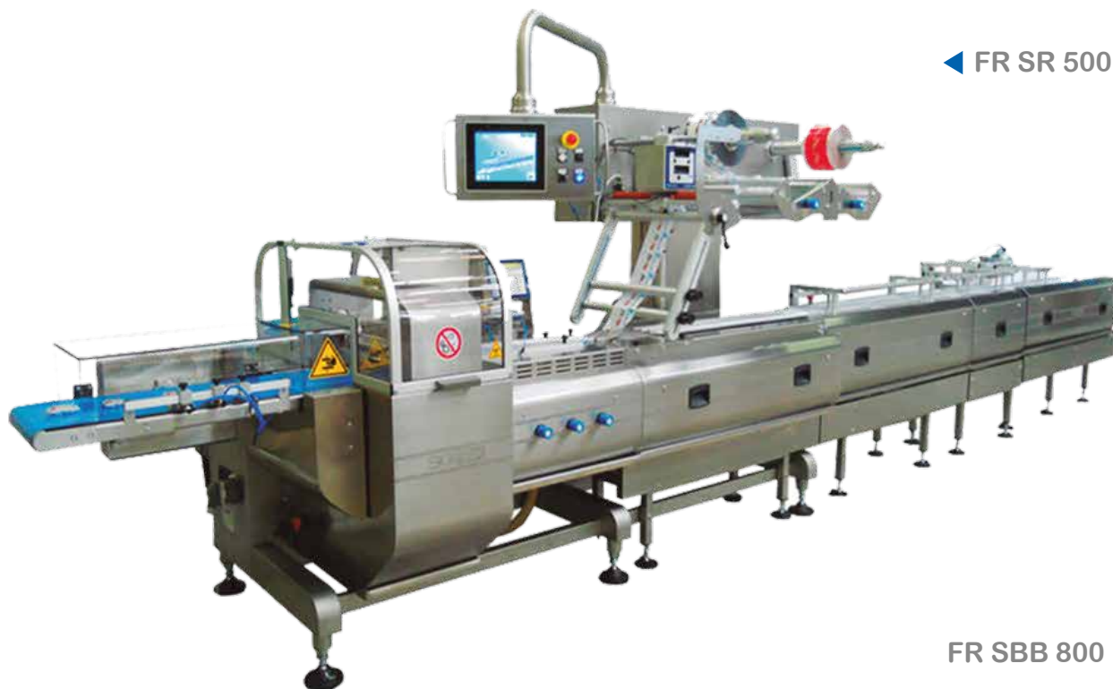
◀ FR SR 500