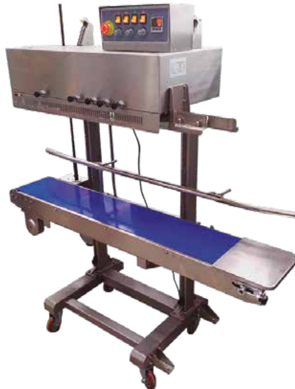
SELL BANDA VERT FRBM1120