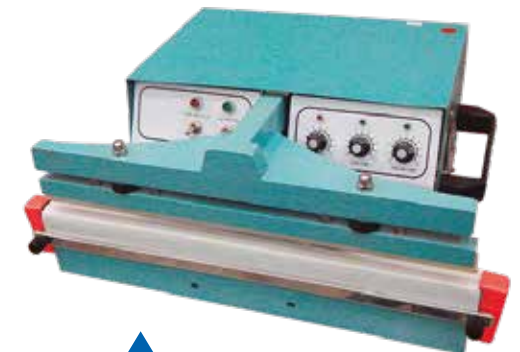
SELL IMP 450T SA MESA