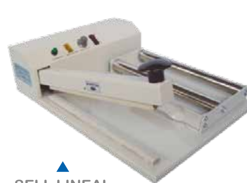
SELL LINEAL RODILLO 450