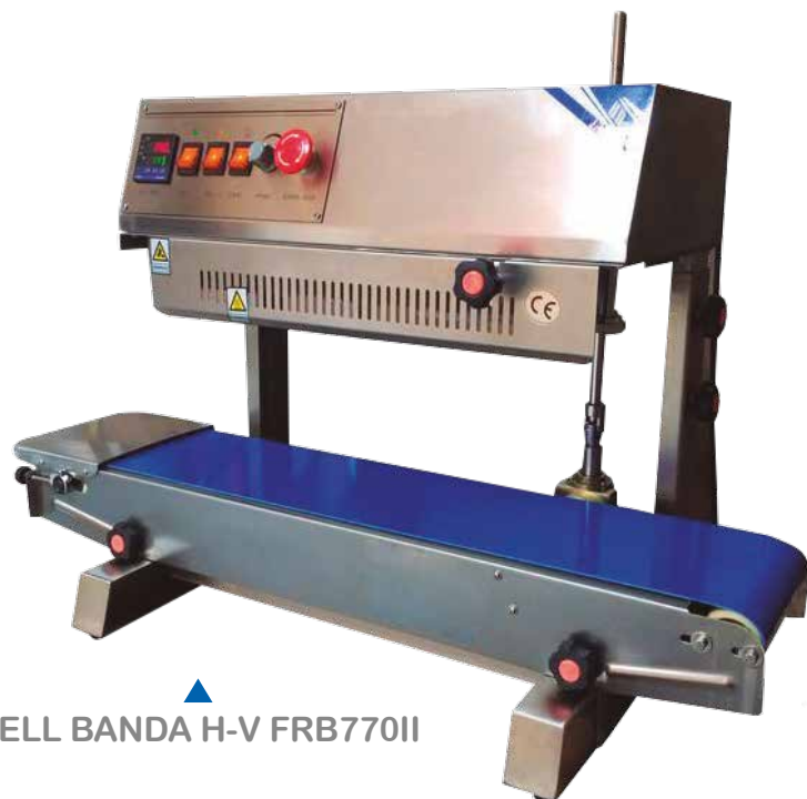
SELL BANDA H-V FRB770II