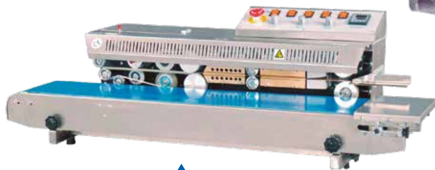
SELL BANDA HOR FRBM810III