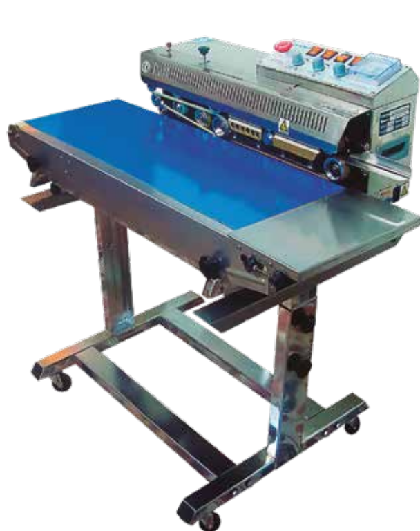
SELL BANDA ANCHA FRBM810