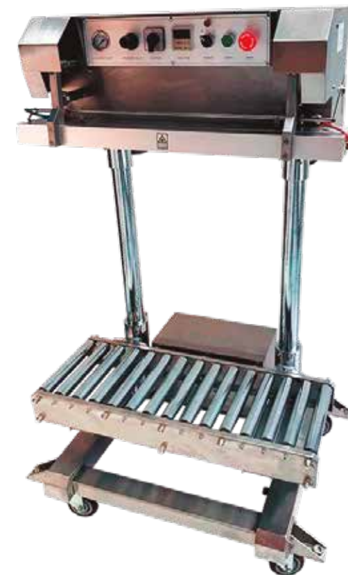
SELL IMP 800 BULTOS INOX