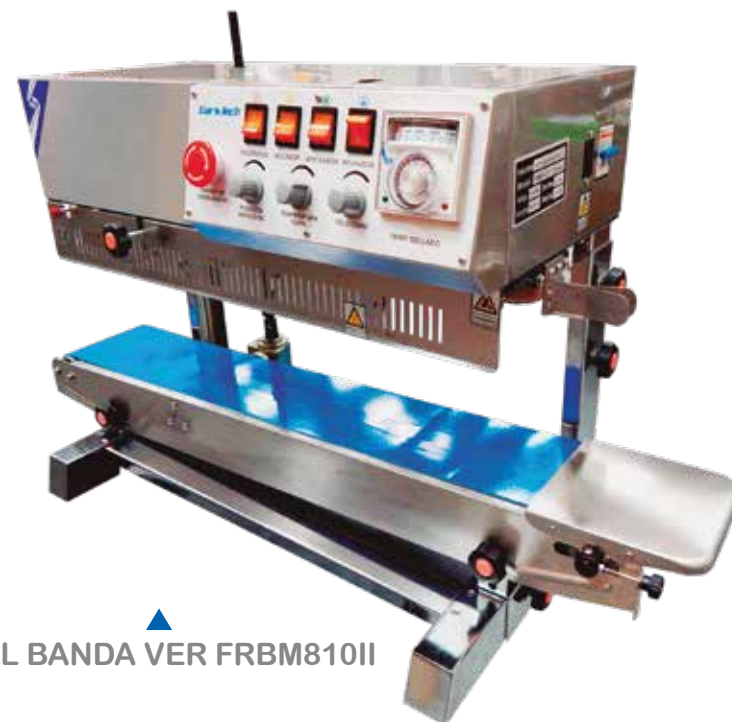
SELL BANDA VER FRBM810II